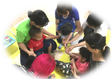
みんなであくしゅ