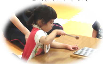
エナジーチャイム